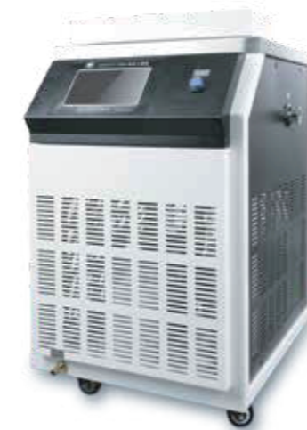
SCIENTZ-12ND 钟罩式冻干机系列