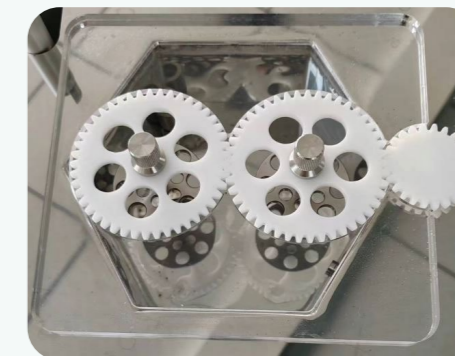
图2: 样品架放置安装